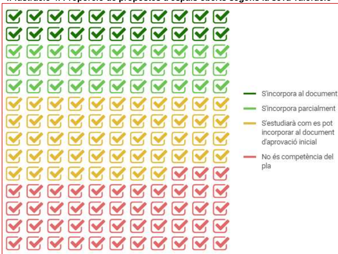
II-lustració 4. Proporció de propostes d'espais oberts segons la seva valoració

Les propostes d'espais oberts que s'incorporen o ho fan parcialment al document d'Avanç són: