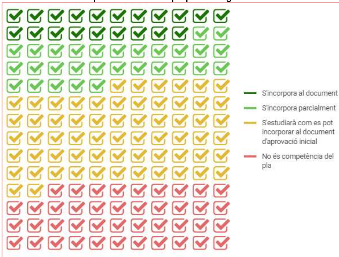
II-lustració 2. Proporció del total de propostes segons la seva valoració

Les propostes s'han classificat seguint l'estructura del document d'Avanç de planejament urbanístic, segons si fan referència a assentaments urbans, espais oberts, infraestructures o bé, tenen un caràcter transversal.