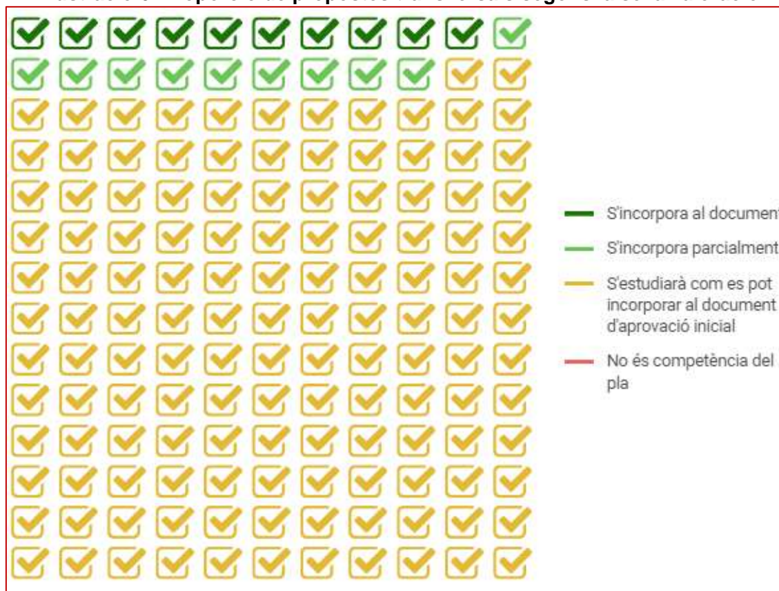
Il·lustració 6. Proporció de propostes transversals segons la seva valoració

Les propostes transversals que s'incorporen o ho fan parcialment al document d'Avanç són: