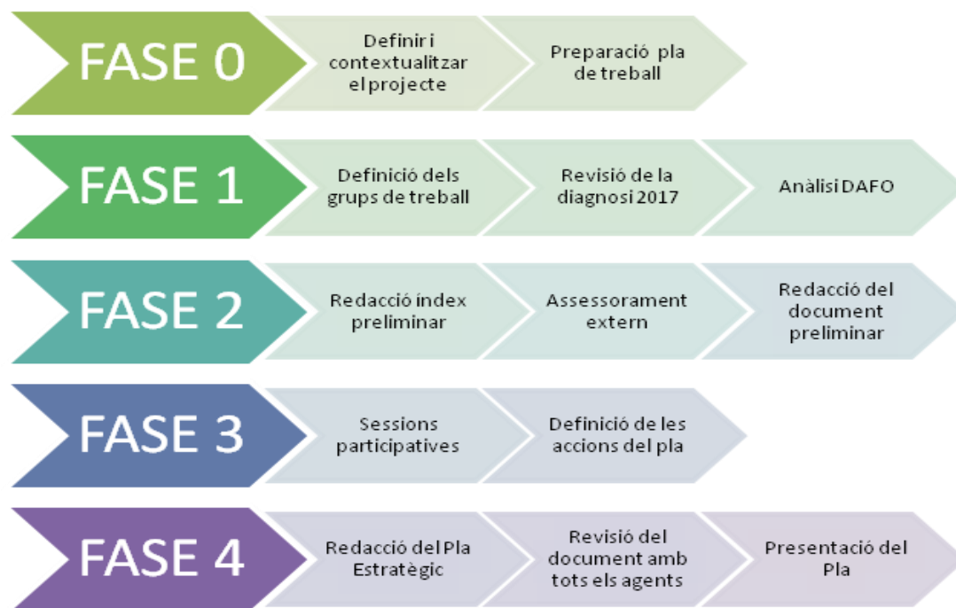
Gràfic 1: quadre resum procés de redacció del Pla estratègic d'educació i voluntariat ambiental al PNCC.

Fase 0: en aquesta sessió es va contextualitzar el projecte, es van definir les tasques a realitzar i es va escriure el guió del pla de treball amb un cronograma preliminar, aprovat per ambdues parts (PNCC i Sorellona).