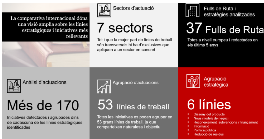
Figura 2. Resum de la comparativa internacional