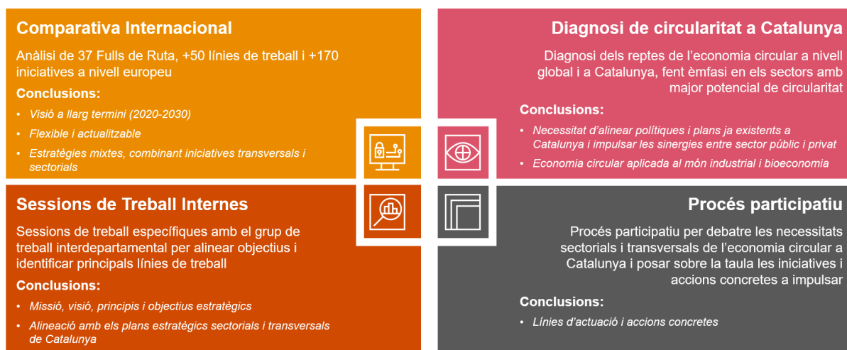
Figura 1. Fases de l'elaboració del Full de Ruta de l'Economia Circular a Catalunya