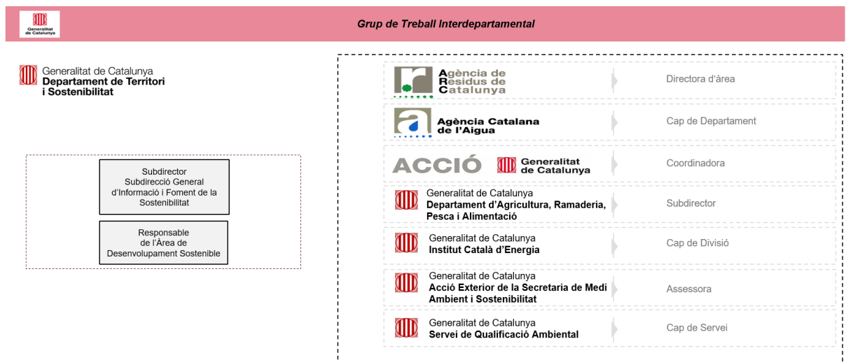
Figura 4. Composició del Grup de Treball Interdepartamental