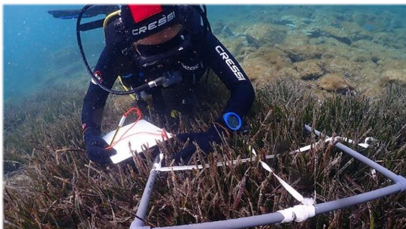
Implementació del protocol de P. oceanica