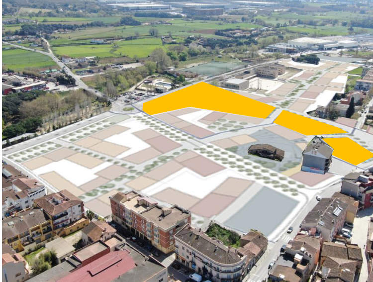
Àmbit del parc del torrent d'en Bosc