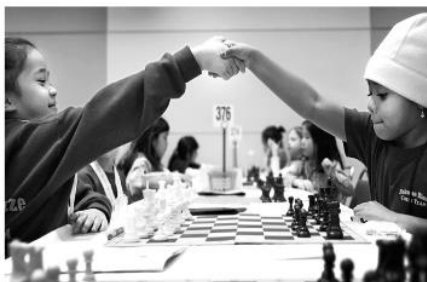
Jocs de taula