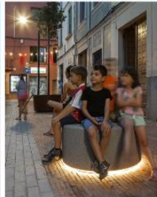
A ras del terra