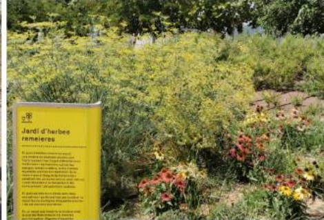
Jardí d'herbes remeieres