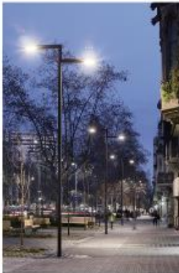
General i funcional