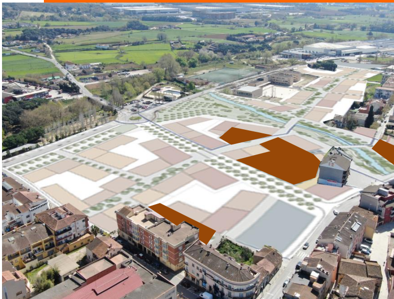
Àmbits de les places del centre