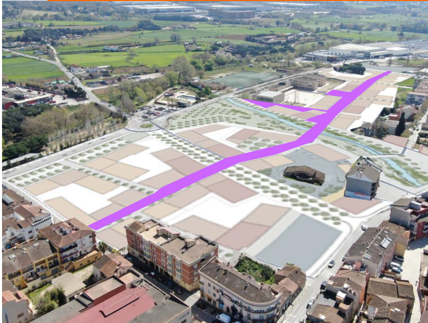
Àmbit del carrer Folch i Torres i espais adjacents