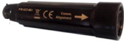
Sensor de temperatura

Obtenir informació sobre les condicions de temperatura a llarg del gradient de profunditat en aigües costaneres.