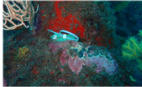
Instal·lació dels termòmetres: Massilla i claus