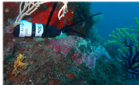
Introducció del termòmetre a cada profunditat