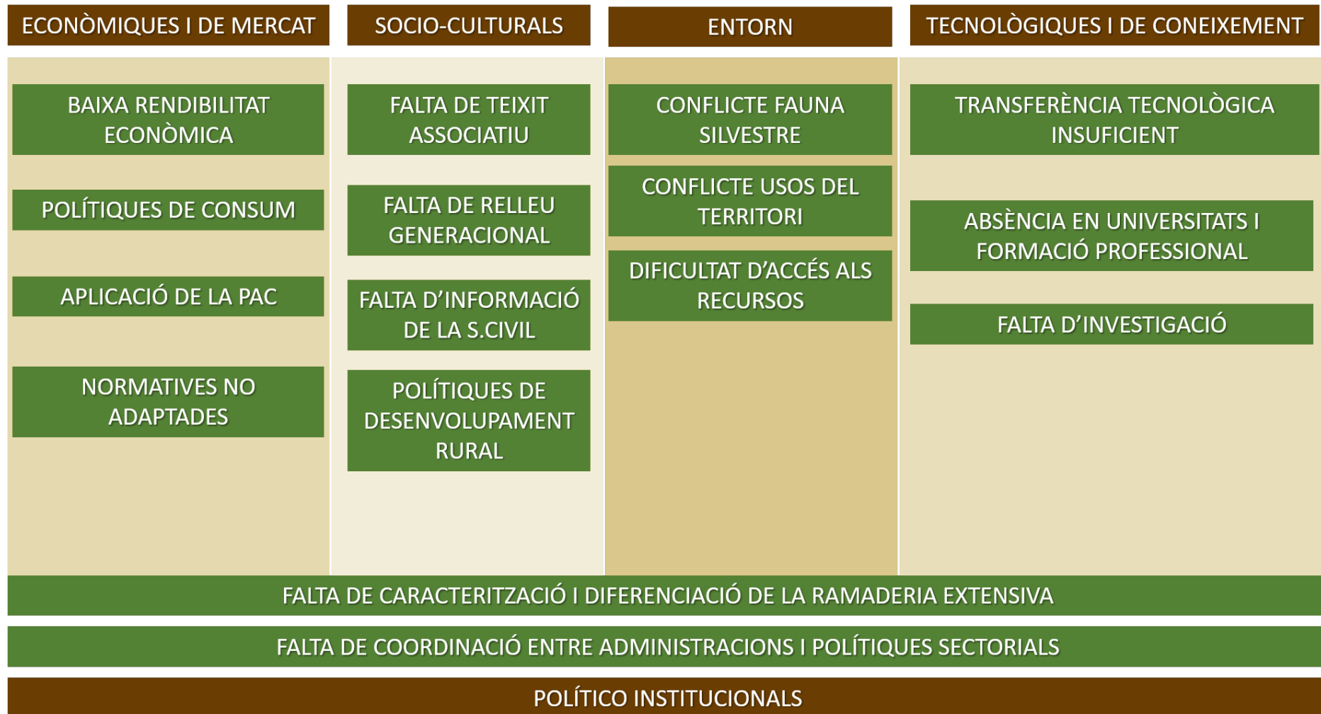
Figura 3. Arbre de problemes realitzat amb la identificació de problemàtiques que enfronta el sector resultat del procés participatiu realitzat a Catalunya. Font: Elaboració pròpia a partir de l'esquema de l'elaborat per WWF España i Trashumancia y Naturaleza per a l'Estrategia Nacional para la Ganadería Extensiva.