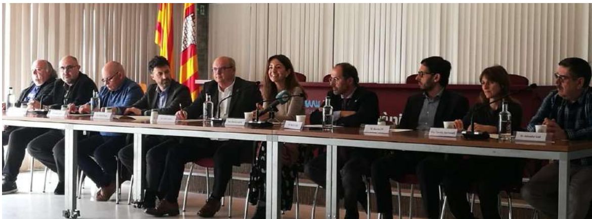
Foto: signatura del conveni "Impuls de projectes estratègics pel desenvolupament local i la creació d'ocupació al PNMMBT" al Museu de la Mediterrània, 2019

Per aquesta raó, i amb l'objectiu de millorar la interrelació municipal en l'impuls de projectes estratègics pel desenvolupament local i la creació d'ocupació, els 8 municipis i el Parc Natural han signat un conveni de col·laboració amb una aportació econòmica suficient com per crear una estructura de treball autoorganitzada que permeti portar a terme uns projectes predefinitos relacionats amb el turisme, el comerç, el valor al producte agrari i l'emprenedoria.